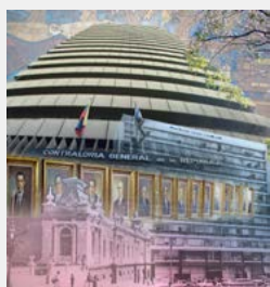
Portada: La historia de la CGR