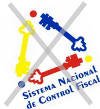
Rotación de los elementos