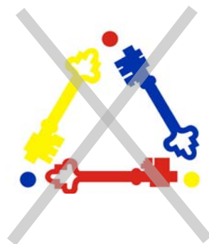
Suprimir el texto